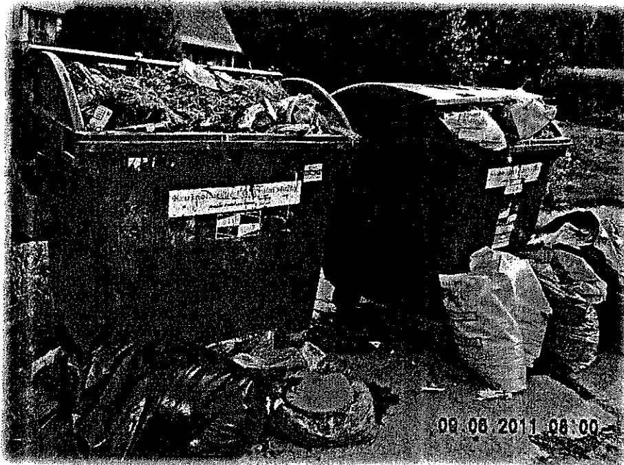
Vizitka zahrádkářů v obci Kučlín

Odpad je movitá věc, které se člověk zbavuje nebo má úmysl nebo povinnost se jí zbavit. Z pohledu práva přesně odpad definuje zákon č. 185/2001 Sb. o odpadech a o změně některých dalších zákonů, kde jsou uvedeny i příslušné definice a povinnosti týkající se odpadů v České republice. Z hlediska obce se odpad dělí na směsný komunální odpad a tříděný komunální odpad.