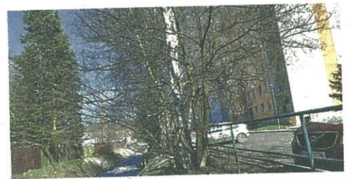
Stromy nebyly fit, tak šly k zemi.

Odborník to viděl podobně. Část stromů museli nechat pokácet