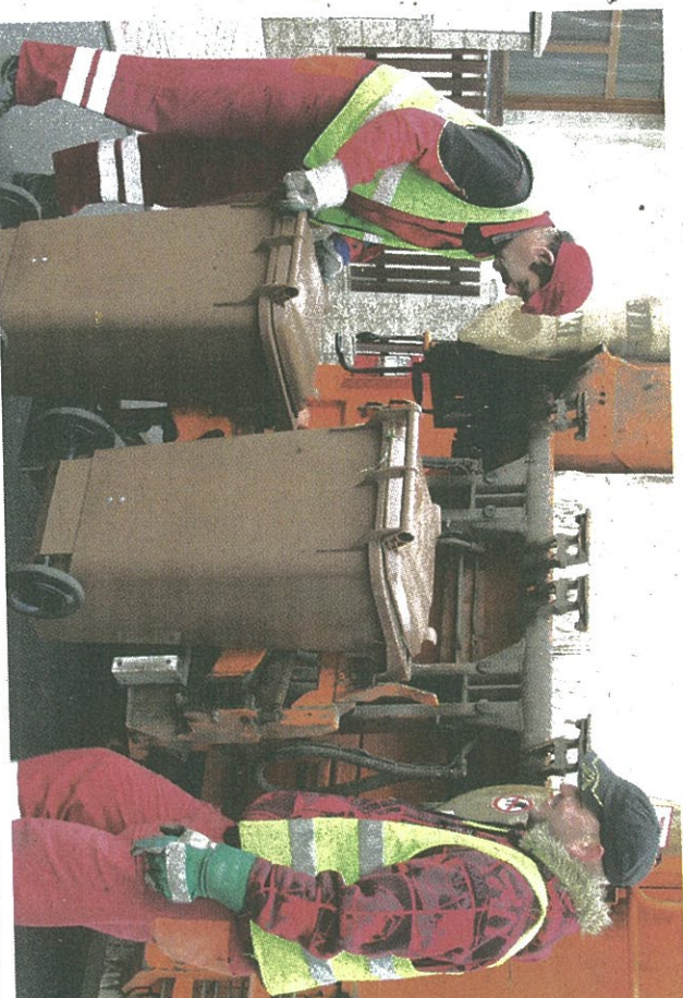
Hrobčice by se mohly zařadit mezi obce s bezplatným svozem odpadu.

Podle statistiky, kterou si obec vypracovala, se v letech 2010 a 2011 ročně na poplatek v Hrobčicích vybralo 293 tisíc korun. V loňském roce to bylo 297